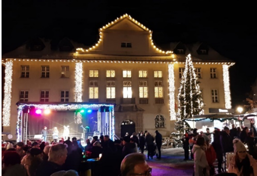
Ballenstedt im Advent