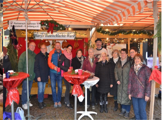
Weihnachtsmarkt in Kronberg

Liebe Mitglieder, liebe Freunde der Städtepartnerschaft Kronberg-Ballenstedt, sehr geehrte Damen und Herren,