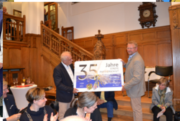
35-Jahr-Feier in Kronberg