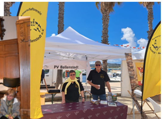
Markt in LeLavandou

Höhepunkte waren sicherlich neben dem Europa-Tag des Hochtaunuskreises hier in Kronberg der gemeinsam ausgerichtete Markt in Le Lavandou bei der die Kommune auf eine 50jährige Freundschaft mit Kronberg zurückblickte, die Teilnahme an der 30-Jahr-Feier Kronberg Porto Recanati und zuletzt unsere kleine stimmungsvolle Veranstaltung zum 35jährigen Bestehen der Verschwisterung mit Ballenstedt hier im Rathaus, zu der auch alle Mitglieder eingeladen waren.